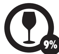
Consumo de Alcohol