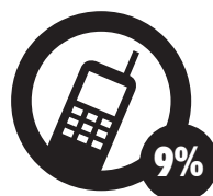
Uso del teléfono móvil