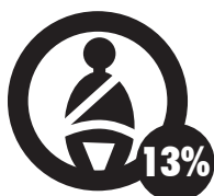
No llevar puesto el cinturón